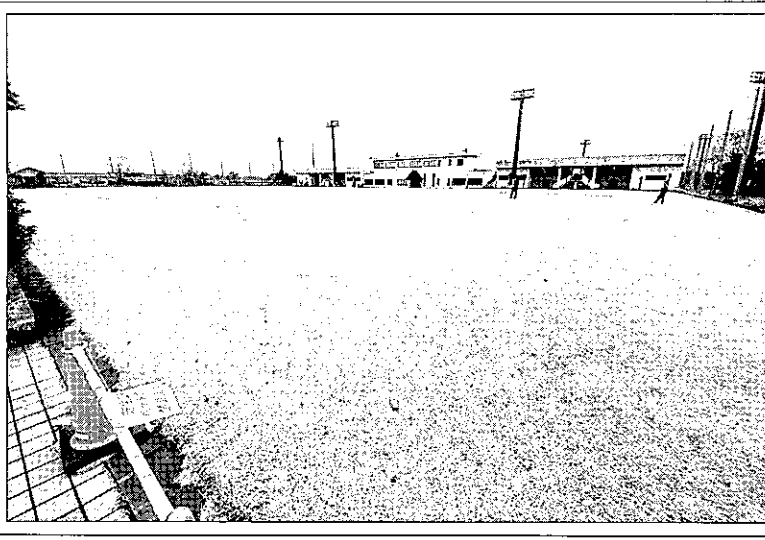
高岡スポーツコアの芝生広場

スポーツコア芝生広場を改修 -高岡市- 新年度照明新設、6年度人工芝張替を予定 高岡市は、同市のスポーツ拠点施設「高岡スポーツコア」にある、「芝生広場」のリニューアル整備を計画している。新年度に照明灯の新設を実施し、令和6年度に全面人工芝化工事を予定している。 スポーツコアは、新高岡駅南に位置する二塚地内の敷地11.4haにあり、サッカー・ラグビー場(面積1万3552㎡)、テニスコート(16面)と、全国大会が開催可能な規模・設備と、多種多様に利用可能な芝生広場などで構成。 整備の対象は天然芝が植えられている芝生広場で、敷地面積は9840㎡。天然芝は使用後に養生期間が必要になることから、利用が制限される場合があった。 市では、こうした制限のない人工芝に張替えを行うとともに、サッカー・ラグビー場と同様に照明